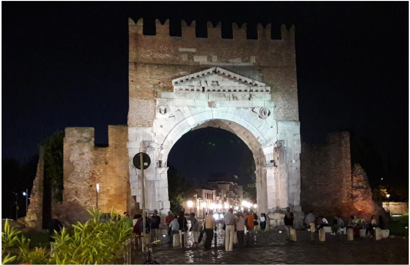
Arco di Augusto