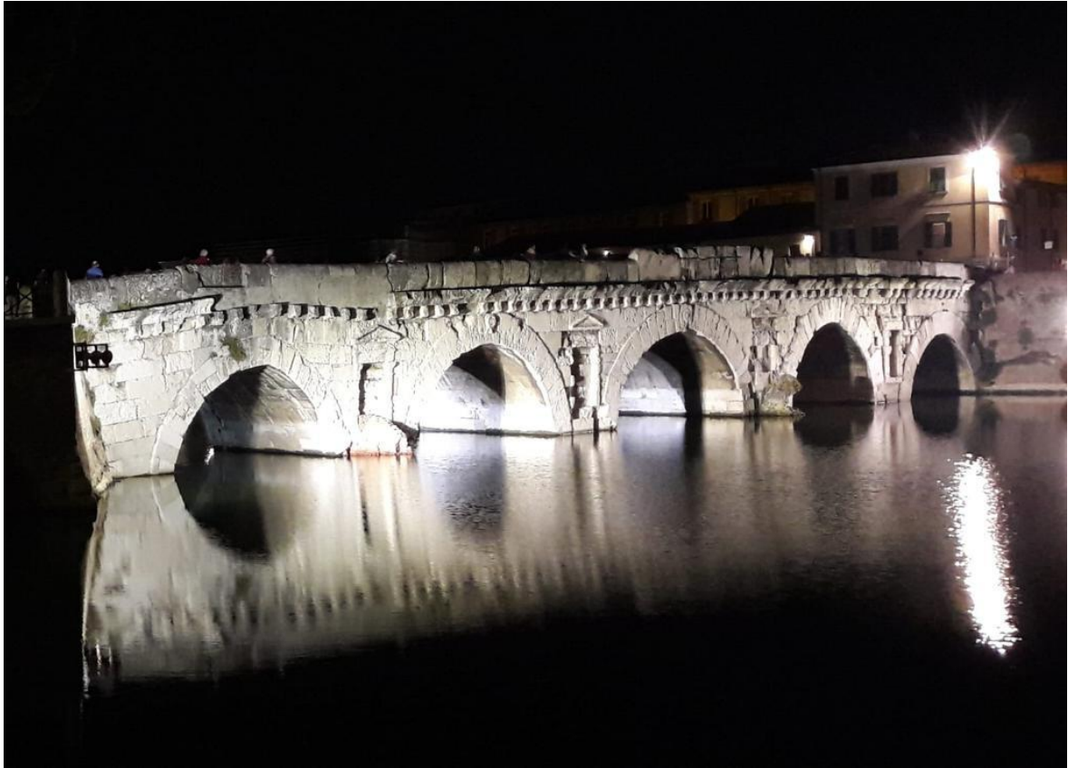
Ponte di Tiberio